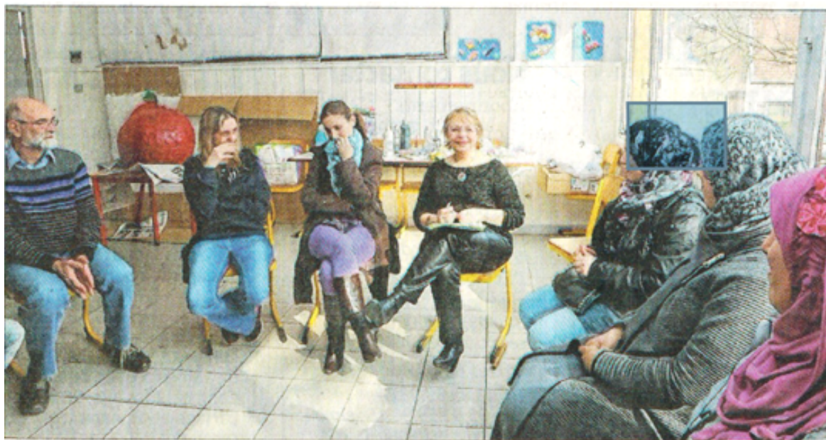
À Vesoul, des parents d'élèves philosophent